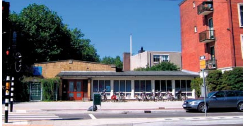
Het consultatiegebouw aan de Amstelveenseweg. Tekening: Henk Oortwijn, foto. c. cilia.

bijna allemaal dezelfde verhoudingen. Dat geeft rust aan de gevels. De hoge ramen hebben onderin een strook vast glas en daarboven valramen. Als je aan een tafel zit kun je door het vaste glas naar buiten kijken. Als je de valramen opendoet komt aan de bovenzijde de buitenlucht naar binnen. Er zullen nooit papieren van de tafels waaien.