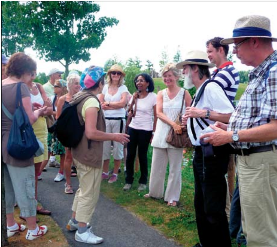
Zondag 4 juli had het Platform Groene Schinkeloevers een eerste wandeling over de Schinkeleilanden en omgeving georganiseerd.

Zondag 26 september a.s. organiseert het Platform Groene Schinkeloevers weer een wandeling langs historische plekken op en bij de Schinkeleilanden.