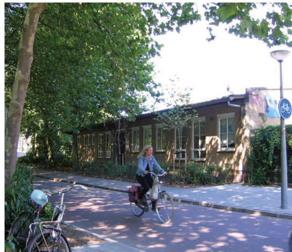
De lommerrijke locatie aan de Amstelveenseweg.

In juni 2009 besloot stadsdeel Amsterdam Oud-Zuid om op de locatie van het voormalig GGD-gebouw aan de Amstelveenseweg 122 nieuwbouw te realiseren met een toren van meer dan 23 meter hoog en een ondergrondse parkeergarage. Een voornemen dat niet paste in het bestemmingsplan, dat het groene karakter van deze historische plek zou aantasten en de drukke oversteek naar het Vondelpark gevaarlijk onoverzichtelijk zou maken. Niet verwonderlijk dus, dat de Actiegroep tegen Hoogbouw Vondelpark/Amstelveenseweg inmiddels al 900 handtekeningen van tegenstanders verzamelde om het stadsdeel op andere gedachten te brengen.