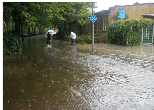
Hier kan je beter met een waterfiets doorheen.